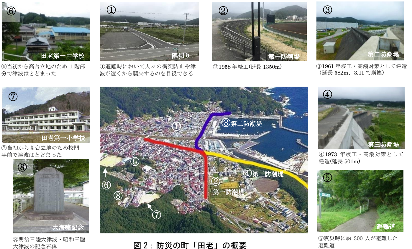
図2：防災の町「田老」の概要