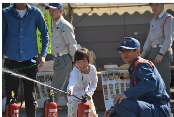
【ふれあい祭りの様子】

はしご車乗車体験にはたくさんのお子ども達が順番待ちし、体験中の子ども達からは歓声と笑顔が溢れていました。また、消火器の取り扱いや住宅用火災警報器の設置についての相談も多く、参加者の防火・防災への関心の高さを感じる1日となりました。