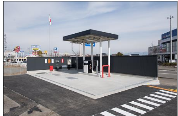
【自家用給油取扱所】

自家用給油取扱所の設置は、長野県内で災害が発生した際の緊急消防援助隊の受援等を考慮し、県の広域防災拠点となる県営松本空港や松本平広域公園から距離が近く、幹線道路（国道19号）に面した場所を選定しました。