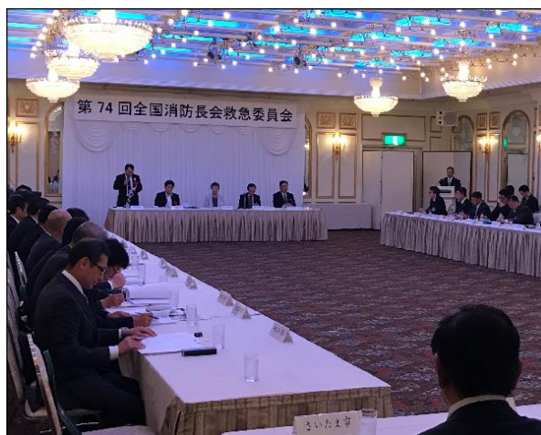
【救急委員会の様子】