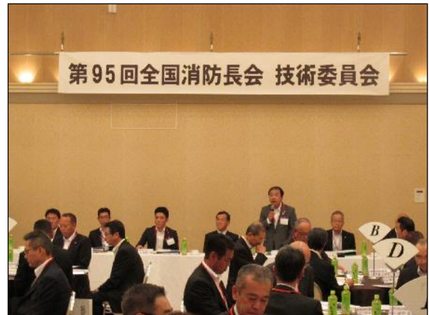
【技術委員会の様子】