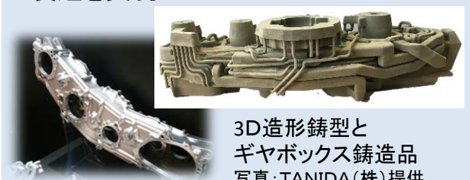
3D造形鋳型と ギヤボックス鋳造品

鋳型造形用3Dプリンターを新規開発. 鋳造メーカーの独自技術との組み合わせにより, 高品質な複雑形状鋳造品の製造を実現.