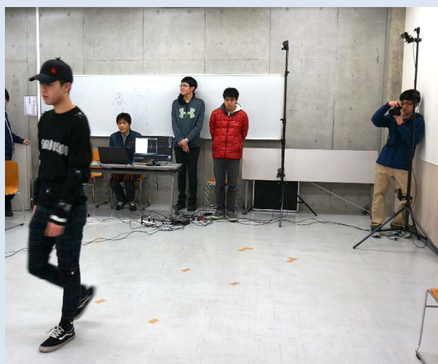
光学式による歩行計測の様子