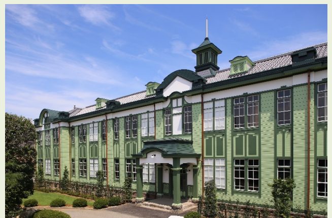
創建当初(大正11年)の校舎に復原整備