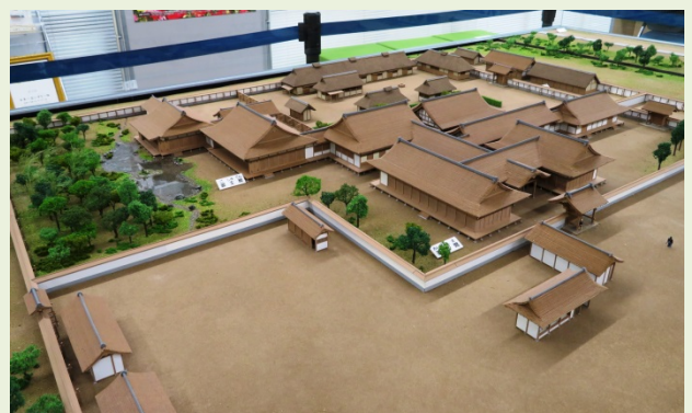
鴻巣御殿再現模型(1/100サイズ)