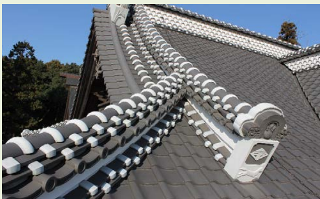
保存修理工事完成後の社殿屋根瓦