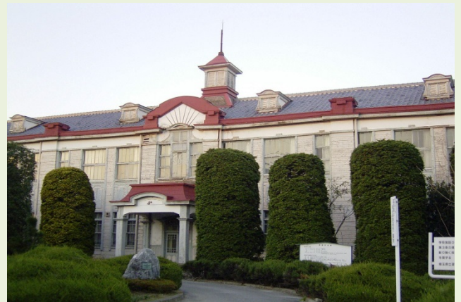
修理前の校舎(戦後の改修)