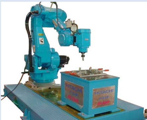
ロボットFSW装置の写真