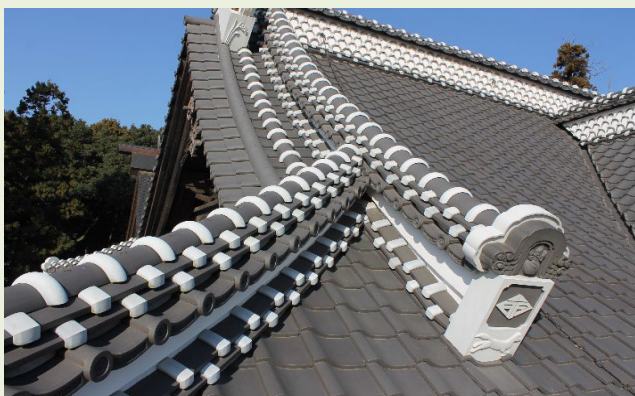
保存修理工事完成後の社殿屋根瓦