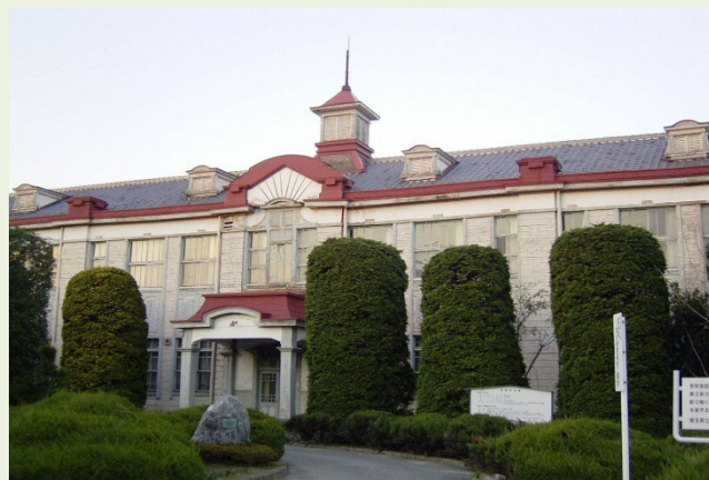
修理前の校舎(戦後の改修)