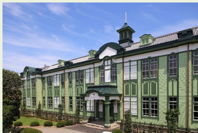
創建当初(大正11年)の校舎に復原整備