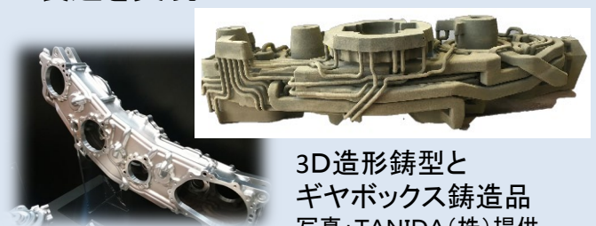
3D造形鋳型と ギヤボックス鋳造品

鋳型造形用3Dプリンターを新規開発. 鋳造メーカーの独自技術との組み合わせにより, 高品質な複雑形状鋳造品の製造を実現.