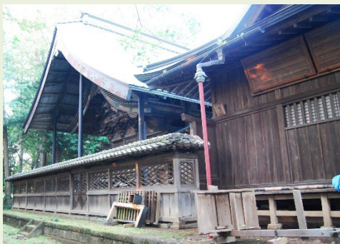
野木神社社殿全景

大工家所蔵の造営関係文書、神社所蔵の造営関係文書、建物調査から得られた情報をもとに、再建における造営の実態を明らかにした。