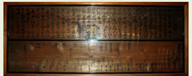
香取神社所蔵の木札

神社所蔵の木札からは造営の経緯・経過や造営に関わった職人に関する情報が読み取れる。