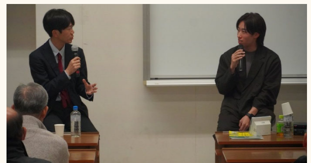
市民講座で埼玉の魅力をテーマに対談

埼玉県教育委員会等の管理職塾を通じ、教育現場へマネジメント理論を導入。また「埼玉学」を軸としたPBLを展開。