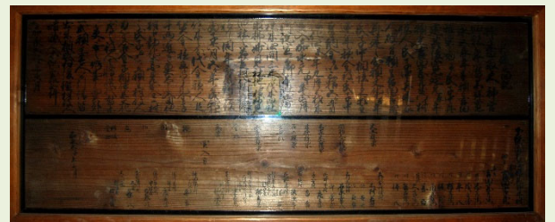
香取神社所蔵の木札

神社所蔵の木札からは造営の経緯・経過や造営に関わった職人に関する情報が読み取れる。