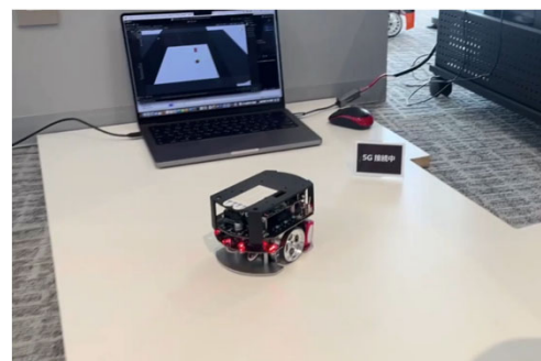
ロボットの実機と仮想のデジタルツイン