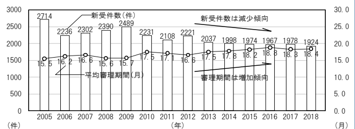
裁判所に持ち込まれた事件数と審理期間の推移