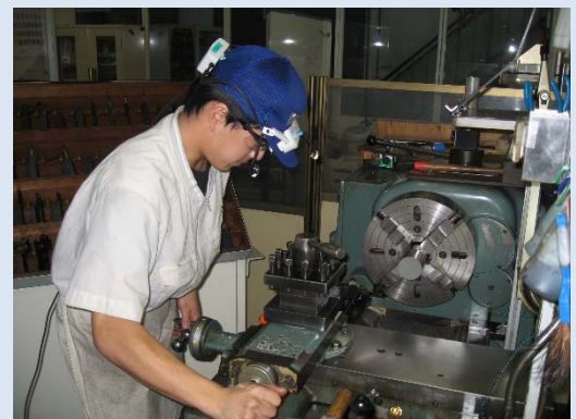
普通旋盤加工時の眼球運動分析