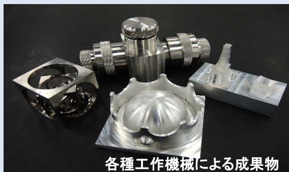
各種工作機械による成果物