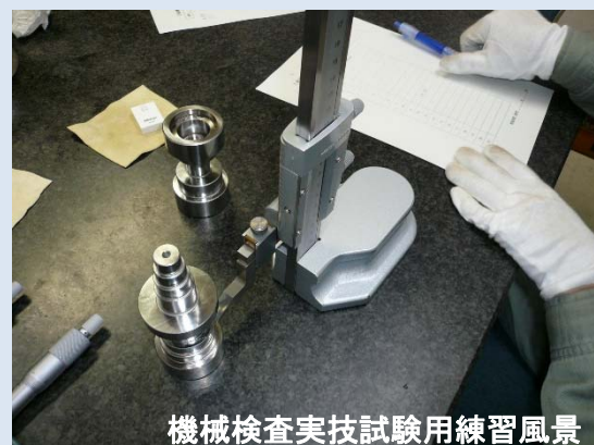
機械検査実技試験用練習風景