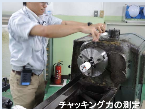
チャッキング力の測定