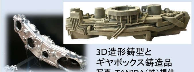
3D造形鋳型と ギヤボックス鋳造品

鋳型造形用3Dプリンターを新規開発. 鋳造メーカーの独自技術との組み合わせにより, 高品質な複雑形状鋳造品の製造を実現.